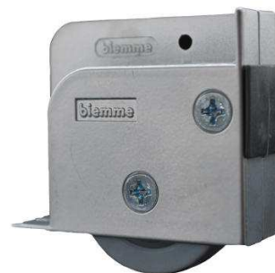
Abb. Anschlag Links ohne Feststeller